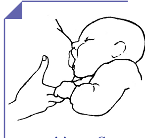
posizione a C

Può essere utile sostenere il seno con la mano a C (pollice sopra l'areola e le altre dita sotto e molto dietro) e stimolare l'apertura della bocca sfiorandola con il capezzolo. Non bisogna forzare il bambino, piegargli la testa verso il seno, aprirgli la bocca a forza con un dito o cose del genere.