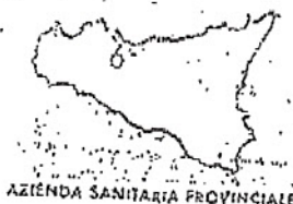
fig. le dell'...

alla Corte e all'attenzione della Dott.ssa Basolala