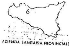
Fig. no. 0000000 P.P.S. Infermiere