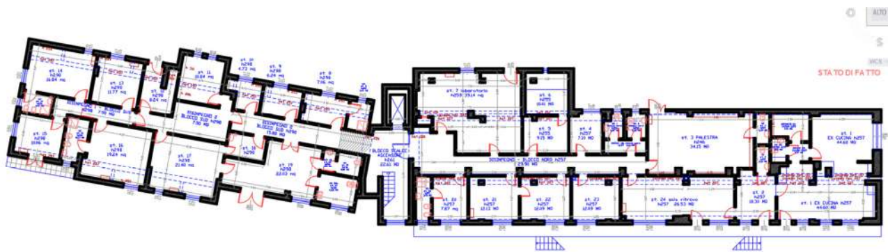
Pianta piano terra