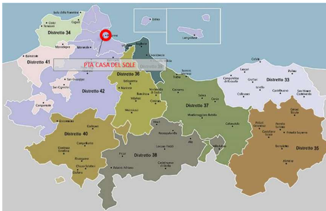
Mappa dei distretti sociosanitari compresi nell'ASP 6 di Palermo

Il PTA Casa del Sole è sito in Via Sarullo, 19, 90135 Palermo, appartenente al distretto sanitario 42 – Palermo