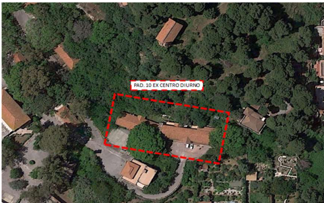
Individuazione area di progetto