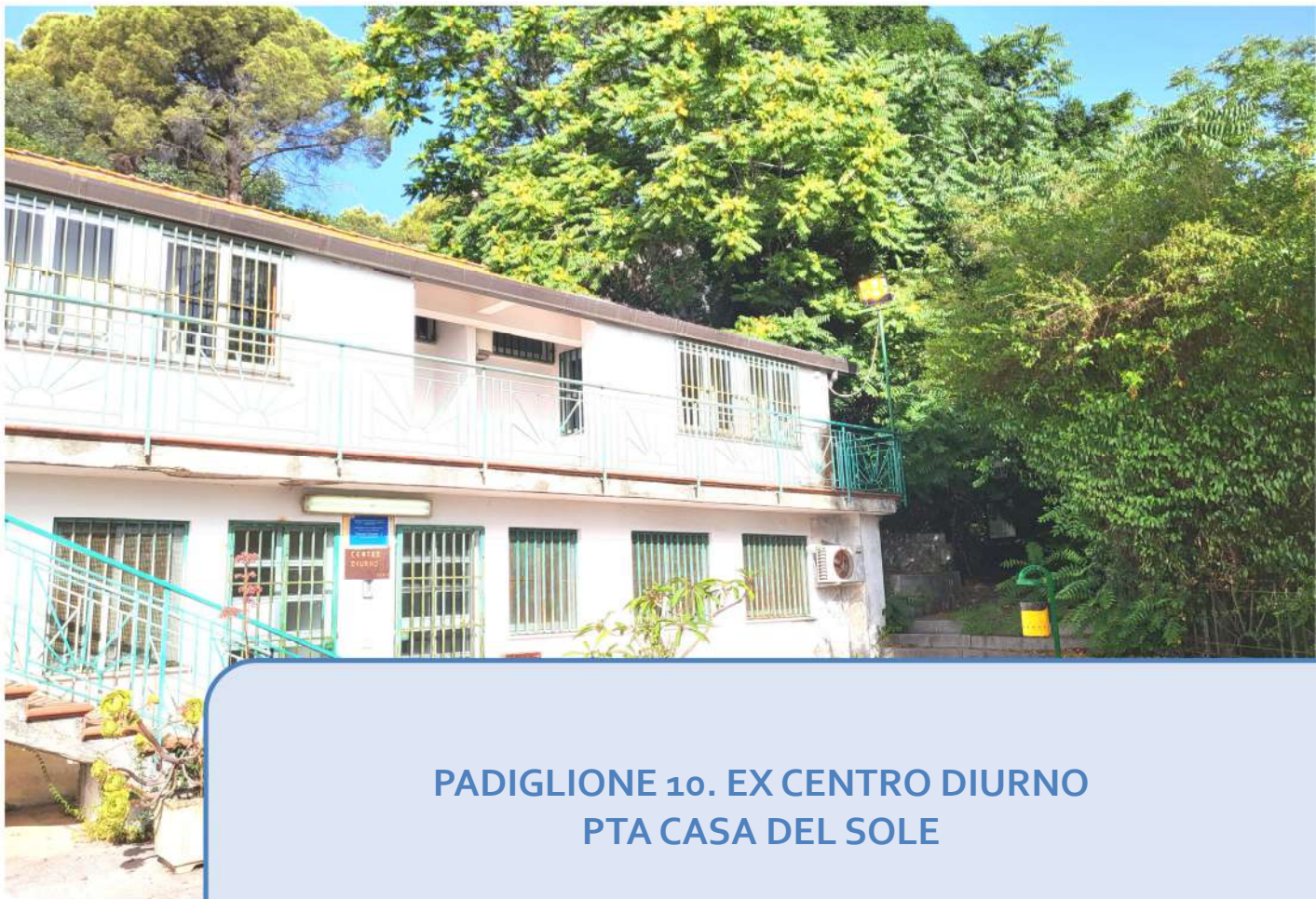
PADIGLIONE 10. EX CENTRO DIURNO PTA CASA DEL SOLE