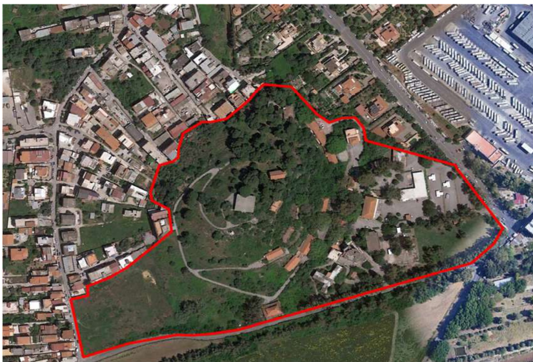
Stralcio aerofotogrammetrico territoriale